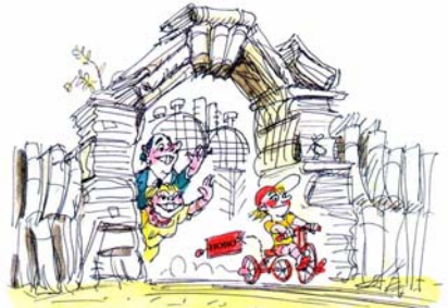
Нов и по-усъвършенстван продукт.