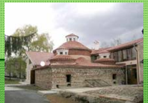
"Турската баня" гр.Разлог