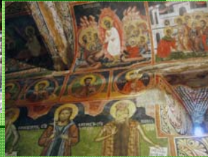
Уникалната църква в село Добърско