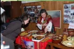
Селски туризъм в гостоприемни къщи за гости